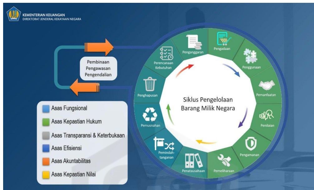
Gambar 1. 1 Siklus Pengelolaan BMN

Pendelegasian Wewenang & Tanggung Jawab BMN, dan Penatausahaan yang dikeluarkan oleh Menteri Keuangan.