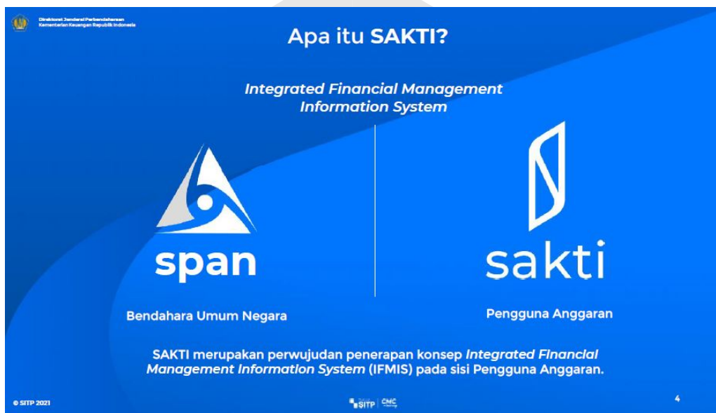
Gambar 1.1 Penerapan IFMIS SAKTI

Sebelum adanya aplikasi SAKTI, proses pengelolaan keuangan di instansi pemerintah seringkali dilakukan secara manual dan terkadang memakan waktu yang cukup lama. Selain itu, proses manual tersebut juga rentan terhadap kesalahan dan kecurangan yang dapat merugikan keuangan negara.