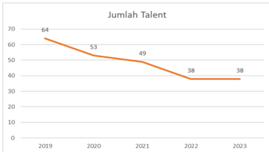
Gambar 1.1 Data Jumlah Talent PT. RRY Manajemen 2019-2023

dunia, talent tersebut masih terikat kontrak dengan perusahaan lain. Jumlah talent pada PT. RRY Manajemen 2019-2023 berdasarkan gambar 1 sebagai berikut.