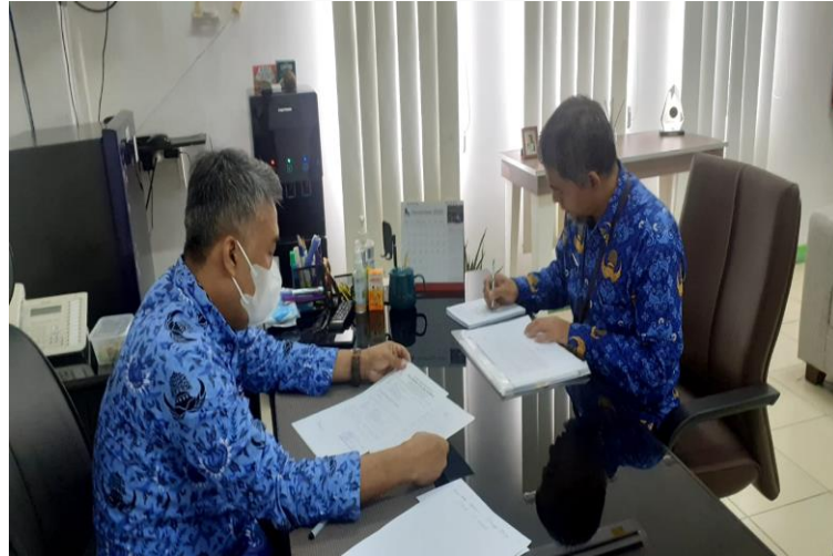
Gambar 4.8 Wawancara dengan Informan 4

“Sebetulnya dengan covid ini semuanya terdampak semuanya apa terdampak semua jadi saya rasa semua sektor terkena semuanya dengan adanya covid-19 ini ya”.