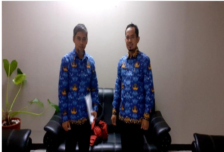
Gambar 4.12 Wawancara dengan Informan 6