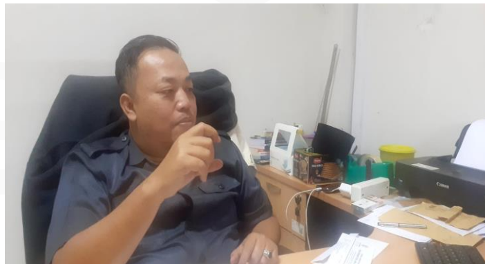
Wawancara dengan informan 3

Wawancara dengan informan 3 Kepala Badan Pusat Statistik Kabupaten Tangerang: