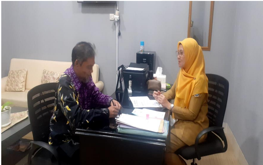
Gambar 4.5 Wawancara dengan informan 5

“Mungkin saya melihatnya Kabupaten Tangerang kalau bicara data Kementerian Pertanian yang menyampaikan bahwa pada saat pandemi di tahun 2020 dan 2021 cenderung sektor pertanian itu memberikan kontribusi yang besar dalam pertumbuhan ekonomi mungkin arahnya bukan ke pertanian tanaman pangan saja, tapi ke sektor perkebunanya.