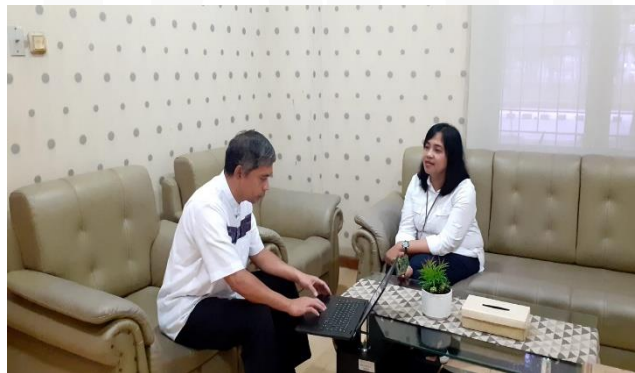
Wawancara dengan informan 1

Wawancara dengan Informan 1 Kepala Bidang Penyusunan, Pengendalian dan Pelaporan Bappeda: