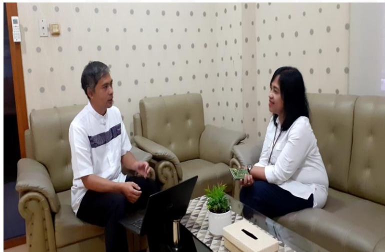
Gambar 4.6 Wawancara dengan informan 1

“Mungkin sektor usaha mikro yang tetap, juga menjadi daya beli masyarakat ekonomi yang pertanian pertanian itu masih bisa bergerak karena memang dari pemerintah daerah juga banyak memberikan bantuannya dari segi subsidi kepada para petani tapi memang kalau secara global di Kabupaten Tangerang dan tidak terlalu signifikan untuk pertanian itu dari sektor pertanian itu hanya sekitar pokoknya 10% 6 sampai 5 sampai 6% jadi walaupun bertahan tapi juga tidak terlalu signifikan untuk pertumbuhan ekonomi lalu, yang sebenarnya dari usaha mikro itu dibidang terdampak tapi mungkin masih bisa dibantu oleh pemerintah daerah karena memang peran pemerintah daerah untuk pengembangan usaha mikro ini cukup besar, perannya karena memang kewenangannya dan membentuk pemerintah daerah untuk industri agak sulit tapi kalau yang bisa dibantu oleh pemerintah mungkin usaha mikro”