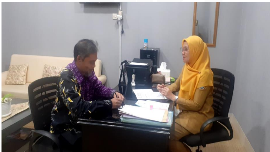
Gambar 4.9 Wawancara dengan informan 5

para anggotanya sehingga kami terapkan yang kami bantu itu ketersediaan pangan kemudian di luar daripada kegiatan rutin yang kami lakukan kami juga melaksanakan pemberian bantuan produksi pada saat itu berupa mesin pompa air karena air merupakan kebutuhan mendasar para petani pada saat mereka ingin meningkatkan dan yang terakhir terkait dengan jadi pelaku-pelaku usaha penggilingan padi ini kan kemarin pada saat itu karena mesinnya beberapa saat tidak berproduksi ada kendala di mesin tingkatannya memberikan bantuan Hanya berupa beberapa alat-alat untuk penggilingan padi mereka dengan harapan dapat beroperasi kembali. “