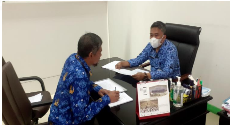
Wawancara dengan Informan 4

“Secara garis besar dikaitkan dengan covid-19 yang ada di Kabupaten Tangerang ini khususnya ada beberapa sektor khususnya di industri apa yang memang berdampak langsung terhadap ekonomi yang ada di perusahaan tersebut dari perusahaan-perusahaan tersebut yang paling banyak berdampak adalah urusannya padat karya, perusahaan yang padat karya itu dimana perusahaan-perusahaan yang menggunakan tenaga kerja besar seperti perusahaan garmen sepatu industri otomotif dan lain-lain, di 2020-2021 bahkan 2022 ini juga terjadi banyak pengurangan terkait dengan global secara mendunia itu berjangkit gitu yang keduanya juga memang secara ekonomi global juga kan sekarang berdampak diantara urusan-urusan tadi itu ada perusahaan-perusahaan yang pada karya, pertama di pabrik-pabrik yang menggunakan tenaga kerja besar yang sifatnya massal yang seperti jahit, sepatu, garmen yang lain, itu paling yang paling banyak berdampak di sekitar beberapa hari ini 2021 itu udah 5000, 2000 .”