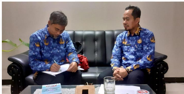
Gambar 4.11 Wawancara dengan informan 6