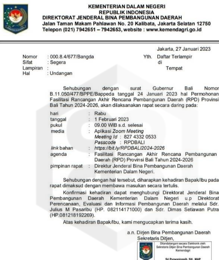
Gambar 4.2 Surat Fasilitas Rancangan Akhir RPD Provinsi Bali Tahun 2024-2026

urusan pemerintahan serta OPD Provinsi Bali yang terdiri dari dinas-dinas yang ada di Bali. Ini sesuai dengan surat Dirjen Bina Pembangunan Daerah Nomor 000.8.4/677/Bangda tanggal 27 Januari 2023 hal undangan untuk menghadiri Fasilitas Rancangan Akhir Rencana Pembangunan Daerah (RPD) Provinsi Bali Tahun 2024-2026 yang dilaksanakan pada tanggal 1 Februari 2023.