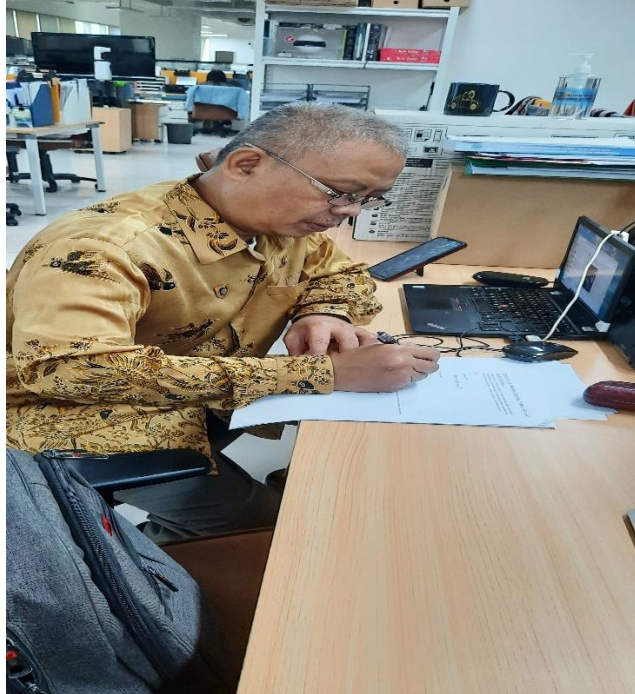
Responden saat mengisi kuisiner tanggal 29 Desember 2021