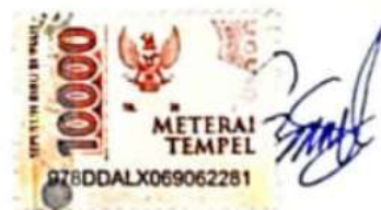
Salsabila Septiani Taufik